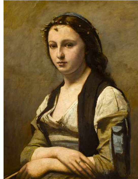
La femme à la perle - Jean Baptiste Camille Corot

https://www.youtube.com/watch?v=6_Vz7hJQxvi#t=228