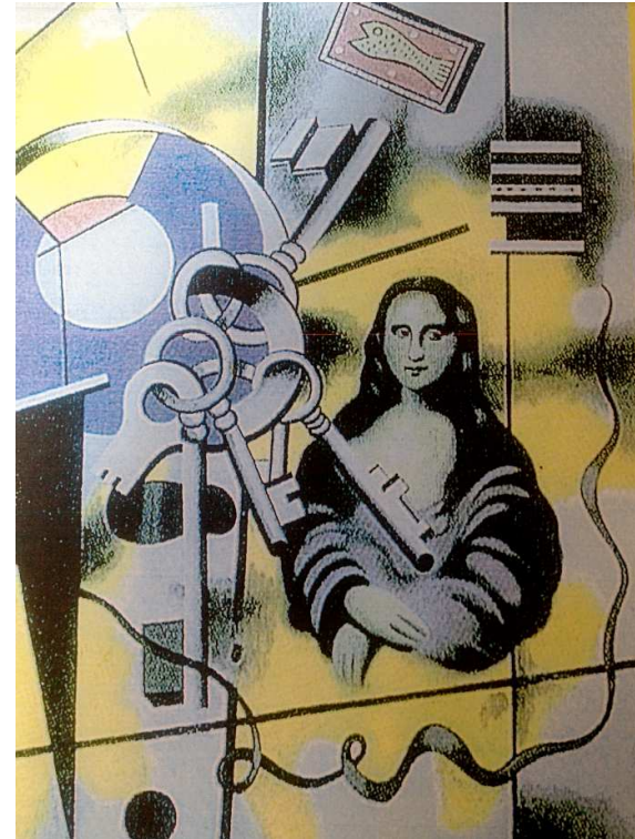
La Joconde aux clés - Fernand Léger

https://www.youtube.com/watch?v=Ifdpk82PMr4#t=40