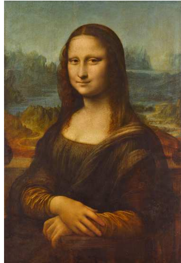
La Joconde- Léonard de Vinci

https://www.youtube.com/watch?v=ZvqiyA14PVU&list=RDZvqiyA14PVU&start_radio=1