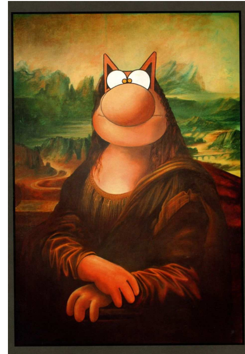
La Joconde revisitée - Geluck

https://www.youtube.com/watch?v=TLz1JUlcSkk&t=16s